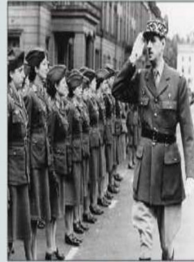
Le Général de Gaulle passe en revue les volontaires féminines de la France Libre.

En 1940, la France capitule et est occupée par l'armée allemande. De Gaulle refuse d'accepter la défaite et part pour l'Angleterre. Le 18 juin 1940, il lance o à la radio de Londres son célèbre appel où il demande à tous les Français de continuer le combat contre l'Allemagne nazie. Pour cet acte de rébellion contre l'autorité officielle, il est condamné à mort par le gouvernement français d'alors. Il organise la Résistance et crée un gouvernement de la «France Libre».